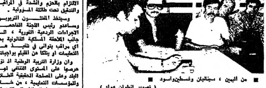
من اليمين، سينيان وفلسطيني وأسد